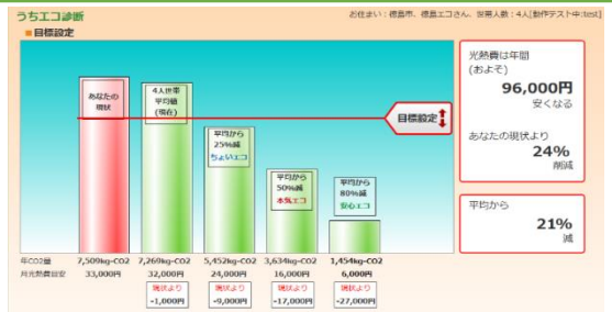
CO2削減目標を設定します