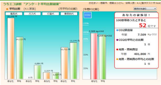
世帯順位やエネルギー消費量が分かります